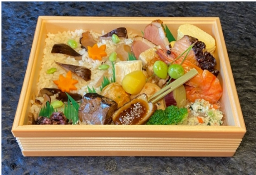
( サイズ 横22cm×縦15.5cm×高さ5cm )